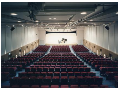
西日本新聞エルガーホール