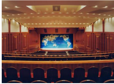
関西外国語大学 谷本記念講堂