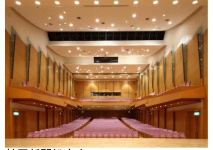
神戸新聞松方ホール