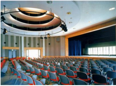
比治山大学 多目的ホール