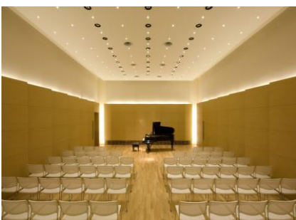
逸翁美術館 マグノリアホール