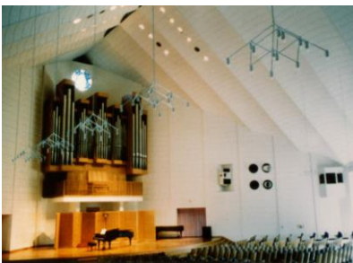
聖カタリナ女子短大 カタリナホール