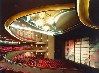
梅田芸術劇場 メインホール