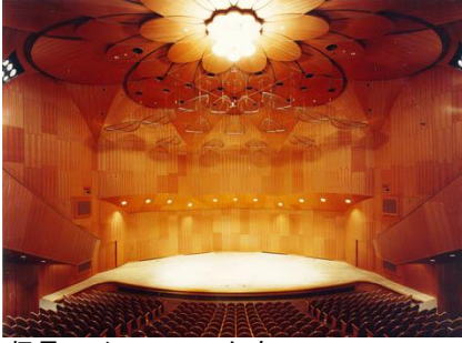
伊丹アイフォニックホール