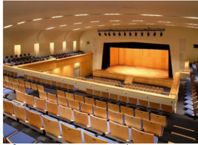
プール学院 メアリーズホール