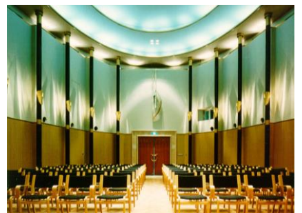
久保惣記念文化財団久保惣ホール