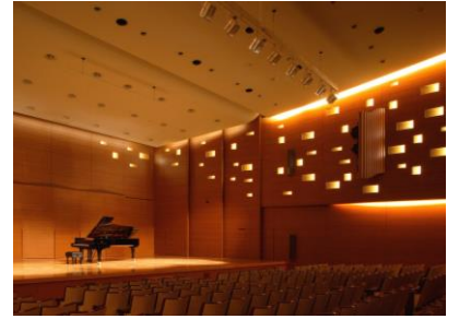
相愛学園本町学舎 講堂