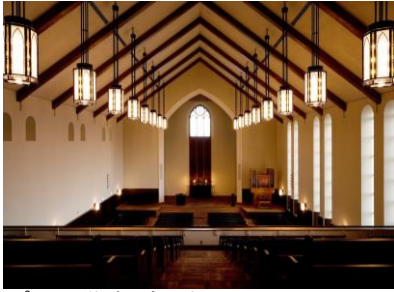
プール学院 清心館