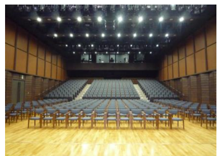
電気ビル みらいホール