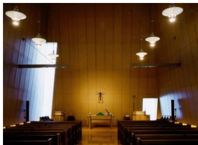
神戸国際大学 チャペル