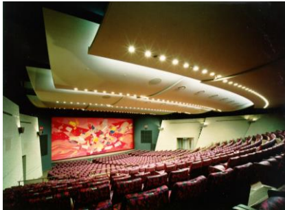
梅田芸術劇場 シアター・ドラマシティ