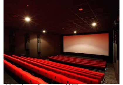
OSシネマズ ミント神戸