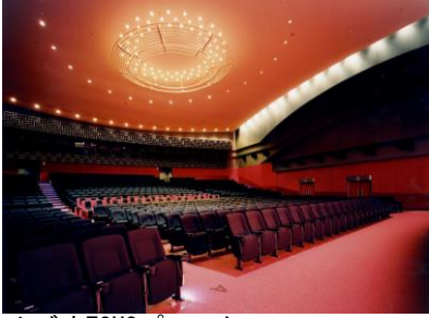
ナビオTOHOプレックス