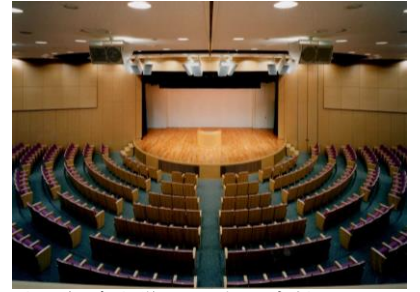
大阪経済大学 70周年記念館