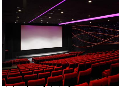
東宝シネマズ なんば