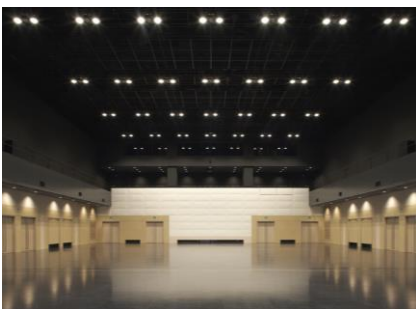
堂島リバーフォーラム